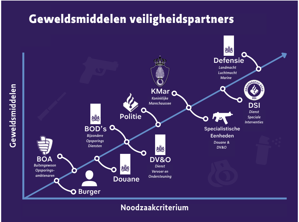
Figuur 2. Geweldsmiddelen veiligheidspartners

gen- en Opsporingsdienst). 17 Een opsporingsambtenaar bij een BOD is verantwoordelijk voor de strafrechtelijke handhaving van de rechtsorde op een specifiek beleidsterrein van een minister. 18 In het kader van hun taakuitvoering hebben zij de bevoegdheid om geweld en vrijheidsbenemende maatregelen te gebruiken. 19